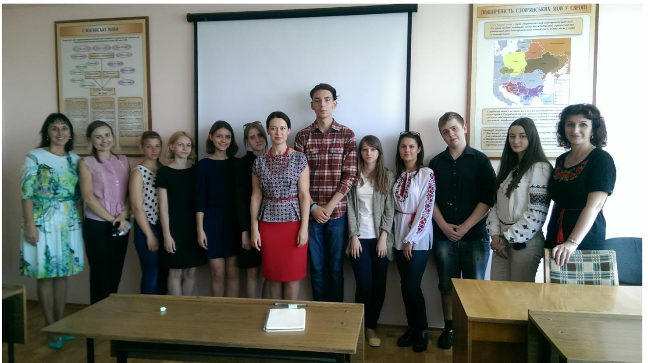
Кафедра слов'янської філології

Шановні першокурсники! Хай студентські роки будуть часом вашого інтелектуального росту, становлення особистості, розкриття творчого потенціалу! Хай роки навчання у Хмельницькому національному університеті наповнять ваше життя новим змістом, розширять коло друзів, будуть багатими на яскраві події та приємні враження! Терпіння вам та наполегливості, енергії та натхнення, удачі та успіхів!